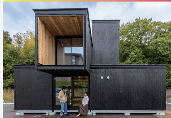
MK10 Mobility