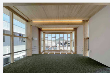
ウッドテクノス社屋