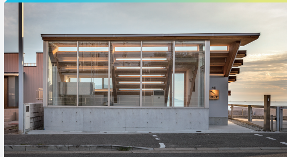
Café CLT (写真撮影：浅川敏)