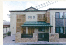
社会福祉法人城陽福祉会 高齢者グループホーム ひだまり鍛冶塚新築工事