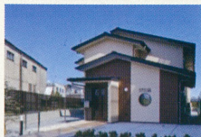
社会福祉法人向陵会 障害者グループホーム ジョイフル上鳥羽新築工事