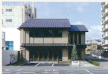
社会福祉法人径福社会 障害者施設LA-GOM新築工事