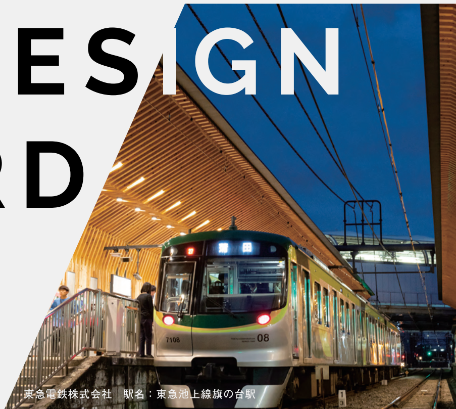
東急電鉄株式会社 駅名：東急池上線旗の台駅