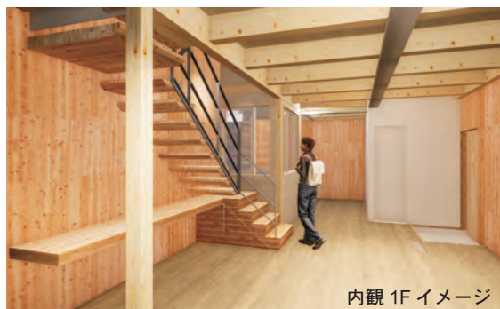
内観 1F イメージ