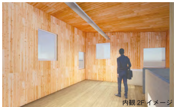
内観 2F イメージ