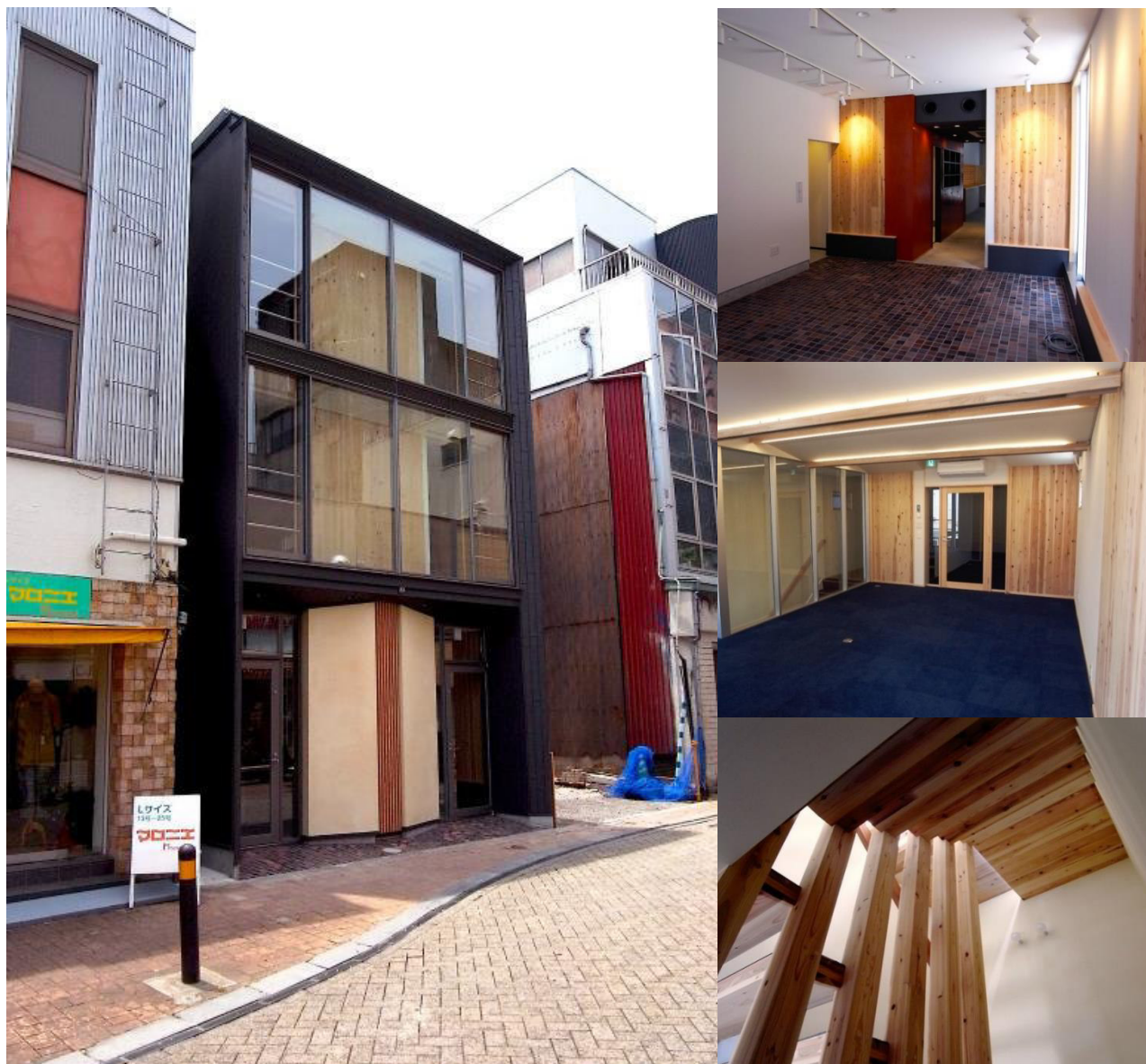
写真撮影：(有)建築設計群 無垢