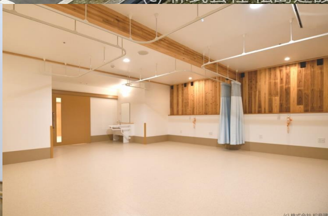
(c) 株式会社 松島建設