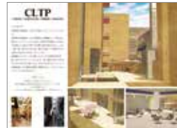
アイデア部門 最優秀賞受賞 作品名：CLTP 受賞者：河本俊登

補助事業名 令和元年度林野庁補助事業「中高層建築物を中心としたCLT等新たな木質建築部材利用促進・定着事業のうちCLT建築物等の設計者等育成」