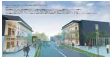
設計部門 農林水産大臣賞受賞 作品名：New Standard for Wooden Architecture 受賞者：三井ホームデザイン研究所