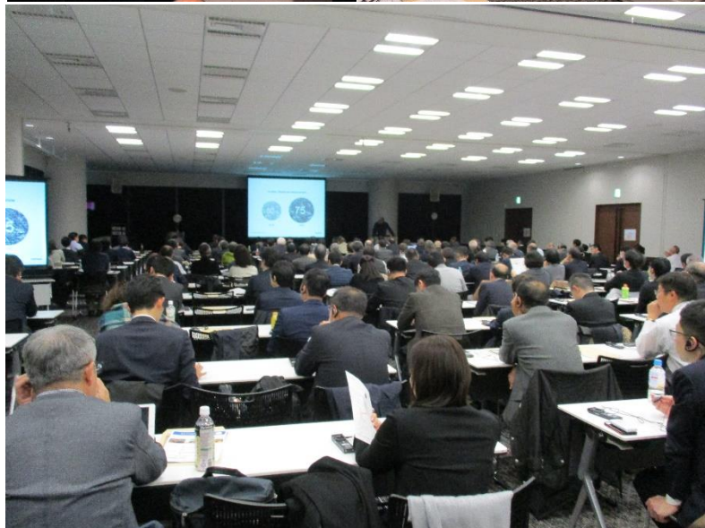
昨年の開催の様子