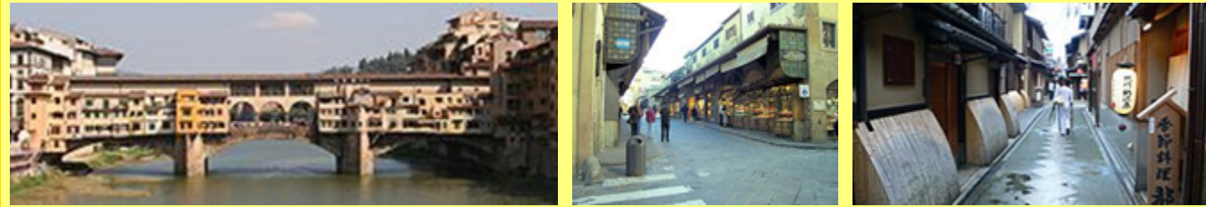
写真左:ヴェッキオ橋外観, 中:ヴェッキオ橋上の通りと店舗, 右:辻子のイメージ

イタリア・フィレンツェのアルノ川に架かるヴェッキオ橋をオマージュして、木の文化が感じられる日本らしい賑わいの空間をCLTにより創り出してみたいと提案を試みました。